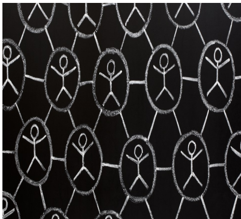
Den teknologiske udvikling vil fremme dele-økonomi og nye fællesskaber

bruttonationallykke). Bhutans models indeholder indikatorer, der blandt andet stiller skarpt på bæredygtighed, kulturbevarelse samt gode styreformer. Blandt de 72 indikatorer findes også sundhed, uddannelse, psykisk velbefindende og tidsforbrug. Alt sammen betyder, at når politikerne skal træffe en beslutning, skal de ikke kun vurdere de økonomiske effekter, men også konsekvenserne for eksempelvis miljø, sundhed og kulturen.