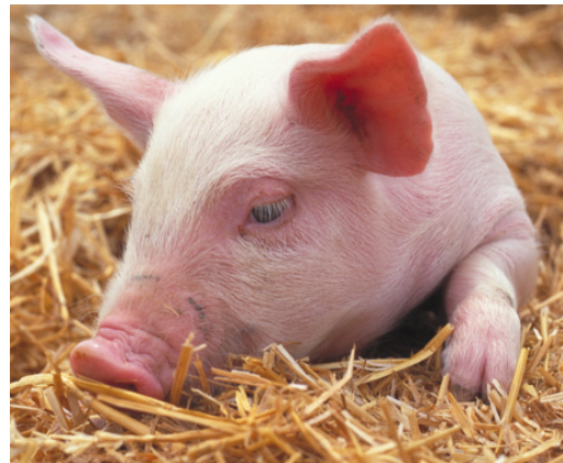
Der dør omkring 24.000 smågrise hver dag i danske stalde.

Næsten halvdelen af alt det vand, der anvendes i USA går til opdræt af dyr til menneskeføde. Det kræver op imod 7-9.000 liter vand for at producere 0,5 kilo kød. Til sammenligning kræver 0,5 kilo hvede kun 95 liter vand. Du sparer altså mere vand ved ikke at spise et halvt kilo kød, end du gør ved ikke at bade i seks måneder!